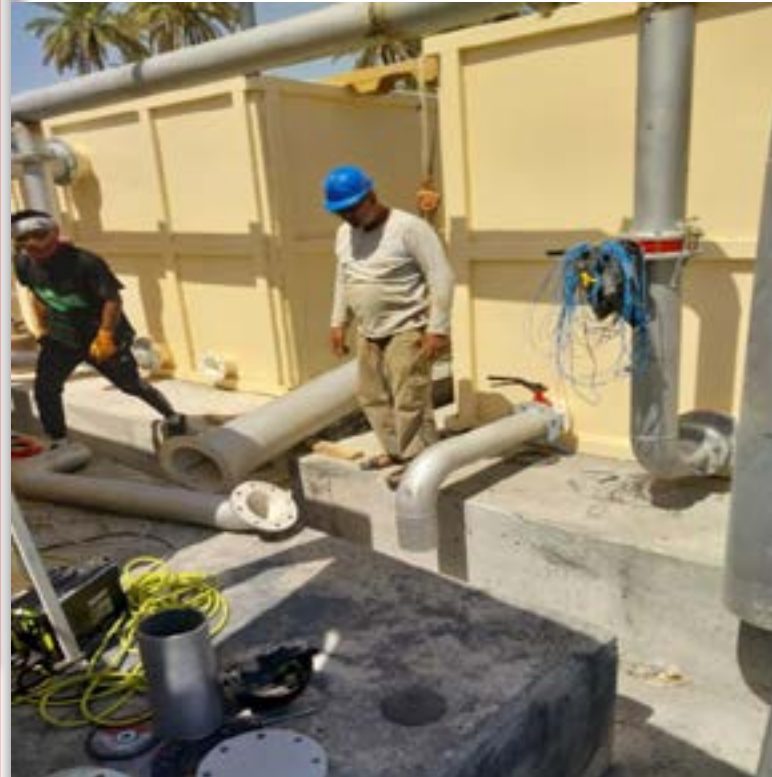
كربلاء المقدسة اخبرنا المهندس المقيم في المشروع الشريف الذي افادنا ان قسم المشاريع الاستراتيجية في محافظة كربلاء المقدسة وحسب توجيهات السيد المحافظ يشرف على تنفيذ مشروع تجهيز ونصب وحدة ماء مجمعة سعة ٣م٥٠٠س في منطقة الدويبية في قضاء الجدول الغربي البالغة كلفته ٣مليار و٧٣مليون و١٤٣ الف دينار مبينا ان نسبة اتمام المشروع بلغت اكثر من ٩٢٪ بعد اتمام كافة الاعمال المدنية والميكانيكية المتمثلة بالوحدة المجمعة ومد ابويها الناقل بطول ٦٧٠٠م وقطر ٤٠٠ملم بالكامل املا اتمام المشروع خلال مدة اقصاها ٣٠ يوما موضحا ان اعمال المشروع تتألف من تهيئة التربة برفع التربة القديمة ودفنها بطبقتين جلود وطبقتي حصى خابط بسمك ٢٥سم لكل طبقة ثم طبقة من الكونكريت غير المسلح بعدها بطبقة من الرفت) او الكونكريت المسلح وتجهيزها لنصب الوحدة المجمعة المنجزة بالكامل مع مد خط بقطر ٤٠٠ملم ويطول ٦٧٠٠م يتألف من ١١١٧ انوب دكتابل عالية الجودة من مناشى عالمية رصينة لتغذية الوحدة المجمعة بالماء الخام من نهر الفرات وذكر الشريف ان فترة اتمام المشروع الذي يأتي ضمن تخصيصات الدعم الطارئ للامن الغذائي حددت بـ ١٨٠ يوما اعتبارا من تاريخ المباشرة منتصف كانون الثاني الماضي الى ذلك اخبرنا مسؤول فرع صيانة وجباية ماء قضا الجدول الغربي المهندس ميثم نايف ان المشروع يعد من المشاريع التعزيرية ضمن القطاع في القضاء ومن المومن ان يرفع مستوى الخدمة في مناطق الدويبية ، طنوية ، الحكمة ، الجدار ، ابو جودع والزبيبية الى نسبة ١٠٠٪ وحل المشكلة التي عانى منها الفرع لسنوات طويلة

عانت قرى غير قليلة في قضاء الجدول الغربي ولسنوات طويلة من شحة ظاهرة في مياه الاسالة الناجمة عن جفاف القنوات المغذية للمجمعات ولعل ابرز تلك القرى هي قرى الحكمة و طنوية . نهر السلام وابو جودع ذات الكثافة السكانية المرتفعة ، هذه الشحة يشند تأثيرها على الاهالي خلال فصل الصيف الجاف الى درجة اجبر معها الاهالي الى هجر النشاط الزراعي والتخلي عن تربية الثروة الحيوانية بل واعتمادهم على السيارات الحوضية التي يؤمنها لهم مركز جباية وصيانة ماء طبيب صيدلاني اخبرني ان الحالة باتت لديهم يرثي لها لا سيما خلال فصل الصيف وان جهود شعبية الموارد المائية في القضاء لا تقدم سوى حل جزئي ووقتي للمشكلة يشاطره الرأي في ذلك علي حسين من اهالي منطقة طنوية واذ كان انشاء قناتهم الاروائية اضحت تجمع للمياه الاسنة اكثر منها قناتة اروائية وهذا يشكل خطر مؤكد على الصحة العامة على حد قوله .. الا ان حكومة كربلاء المحلية متمثلة بشخص السيد المحافظ المهندس نصيف جاسم الخطابي حرصت على وضع الحلول الدقيقة والمدروسة فيقول لنا المواطن اركان العباسي انهم عانوا من المشكلة لسنوات طويلة وهم يأملون خيرا بالمشروع الذي تنفذه حاليا محافظة كربلاء المقدسة في مناطقهم قد حقت فيه الشركة شوطا كبيرا من الانجاز ويعودونه المنقل لهم بحسب العباسي وحول المشروع المنتظر بترقب والذي يشرف عليه قسم المشاريع الاستراتيجية في محافظة