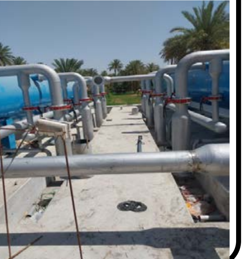
كربلاء المقدسة اخبرنا المهندس المقيم في المشروع الشريف الذي افادنا ان قسم المشاريع الاستراتيجية في محافظة كربلاء المقدسة وحسب توجيهات السيد المحافظ يشرف على تنفيذ مشروع تجهيز ونصب وحدة ماء مجمعة سعة ٣م٥٠٠س في منطقة الدويبية في قضاء الجدول الغربي البالغة كلفته ٣مليار و٧٣مليون و١٤٣ الف دينار مبينا ان نسبة اتمام المشروع بلغت اكثر من ٩٢٪ بعد اتمام كافة الاعمال المدنية والميكانيكية المتمثلة بالوحدة المجمعة ومد ابويها الناقل بطول ٦٧٠٠م وقطر ٤٠٠ملم بالكامل املا اتمام المشروع خلال مدة اقصاها ٣٠ يوما موضحا ان اعمال المشروع تتألف من تهيئة التربة برفع التربة القديمة ودفنها بطبقتين جلود وطبقتي حصى خابط بسمك ٢٥سم لكل طبقة ثم طبقة من الكونكريت غير المسلح بعدها بطبقة من الرفت) او الكونكريت المسلح وتجهيزها لنصب الوحدة المجمعة المنجزة بالكامل مع مد خط بقطر ٤٠٠ملم ويطول ٦٧٠٠م يتألف من ١١١٧ انوب دكتابل عالية الجودة من مناشى عالمية رصينة لتغذية الوحدة المجمعة بالماء الخام من نهر الفرات وذكر الشريف ان فترة اتمام المشروع الذي يأتي ضمن تخصيصات الدعم الطارئ للامن الغذائي حددت بـ ١٨٠ يوما اعتبارا من تاريخ المباشرة منتصف كانون الثاني الماضي الى ذلك اخبرنا مسؤول فرع صيانة وجباية ماء قضا الجدول الغربي المهندس ميثم نايف ان المشروع يعد من المشاريع التعزيرية ضمن القطاع في القضاء ومن المومن ان يرفع مستوى الخدمة في مناطق الدويبية ، طنوية ، الحكمة ، الجدار ، ابو جودع والزبيبية الى نسبة ١٠٠٪ وحل المشكلة التي عانى منها الفرع لسنوات طويلة

عانت قرى غير قليلة في قضاء الجدول الغربي ولسنوات طويلة من شحة ظاهرة في مياه الاسالة الناجمة عن جفاف القنوات المغذية للمجمعات ولعل ابرز تلك القرى هي قرى الحكمة و طنوية . نهر السلام وابو جودع ذات الكثافة السكانية المرتفعة ، هذه الشحة يشند تأثيرها على الاهالي خلال فصل الصيف الجاف الى درجة اجبر معها الاهالي الى هجر النشاط الزراعي والتخلي عن تربية الثروة الحيوانية بل واعتمادهم على السيارات الحوضية التي يؤمنها لهم مركز جباية وصيانة ماء طبيب صيدلاني اخبرني ان الحالة باتت لديهم يرثي لها لا سيما خلال فصل الصيف وان جهود شعبية الموارد المائية في القضاء لا تقدم سوى حل جزئي ووقتي للمشكلة يشاطره الرأي في ذلك علي حسين من اهالي منطقة طنوية واذ كان انشاء قناتهم الاروائية اضحت تجمع للمياه الاسنة اكثر منها قناتة اروائية وهذا يشكل خطر مؤكد على الصحة العامة على حد قوله .. الا ان حكومة كربلاء المحلية متمثلة بشخص السيد المحافظ المهندس نصيف جاسم الخطابي حرصت على وضع الحلول الدقيقة والمدروسة فيقول لنا المواطن اركان العباسي انهم عانوا من المشكلة لسنوات طويلة وهم يأملون خيرا بالمشروع الذي تنفذه حاليا محافظة كربلاء المقدسة في مناطقهم قد حقت فيه الشركة شوطا كبيرا من الانجاز ويعودونه المنقل لهم بحسب العباسي وحول المشروع المنتظر بترقب والذي يشرف عليه قسم المشاريع الاستراتيجية في محافظة